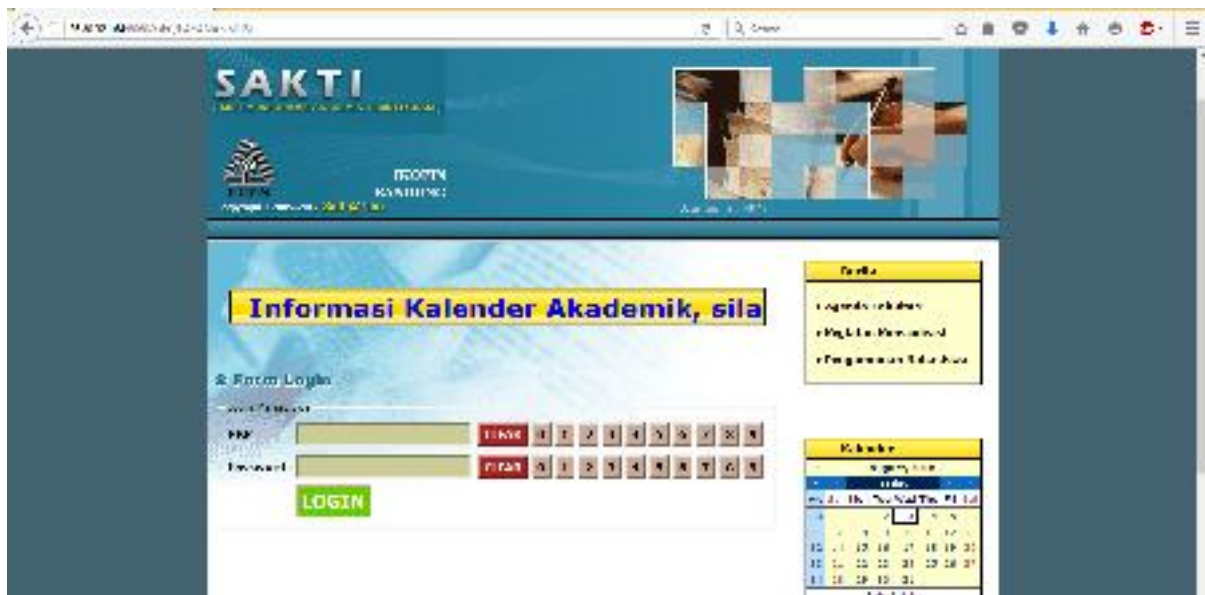
Dialog Login Layanan Mahasiswa

Tampilan awal untuk Layanan Mahasiswa adalah dialog login sebagai berikut :