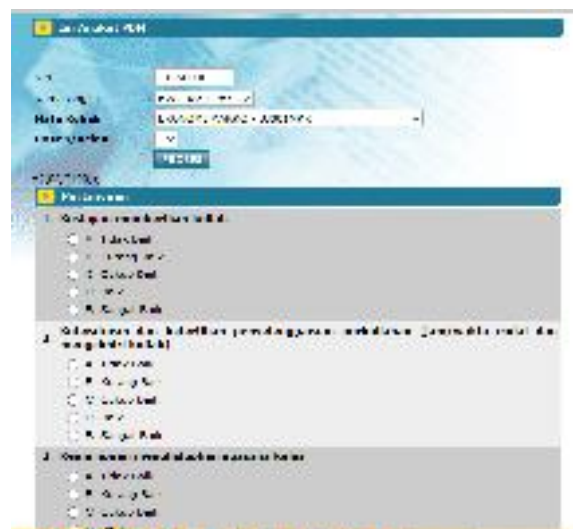
Form Evaluasi PBM

Isi Angket PBM | Isi Mata Kuliah | Pilih Dosen/kelas sehingga muncul dialog sbb.: