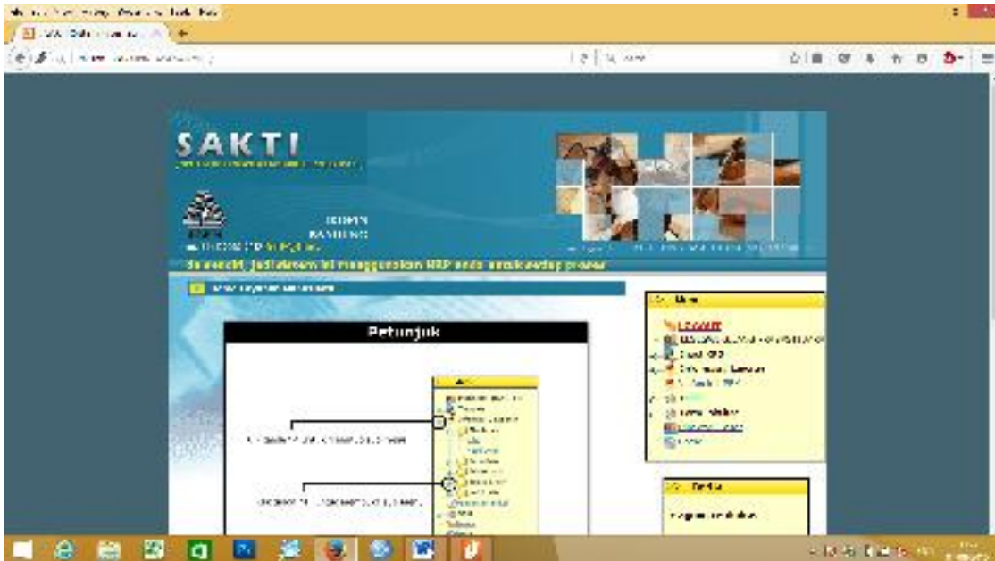
Halaman depan modul layanan mahasiswa

Catatan: Klik tanda (+) untuk membuka sub menu dan tanda (-) untuk menutupnya. Sedangkan untuk menjalankan perintah pilih menu yang dimaksud.