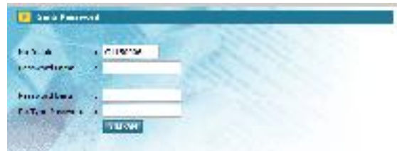
Form ubah password

Utilitas dimanfaatkan untuk mengganti password ybs. untuk alasan keamanan akses. Pilih menu Utilitas | Ganti Password sehingga muncul dialog :