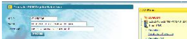
Form Transaksi PKRS Reguler Mahasiswa

Transaksi perubahan dapat dipilih di menu Input KRS | Perubahan Perwalian.