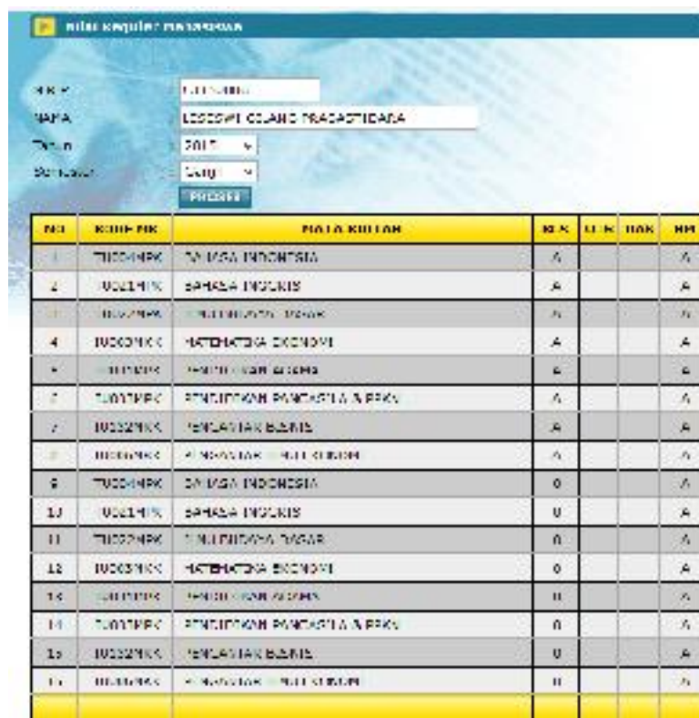
Nilai Ujian Reguler

Informasi akademik di antaranya adalah informasi nilai yang telah dicapai oleh mahasiswa. Akses menu Informasi Akademik | Nilai | Nilai Ujian Reguler sehingga muncul dialog sbb.: