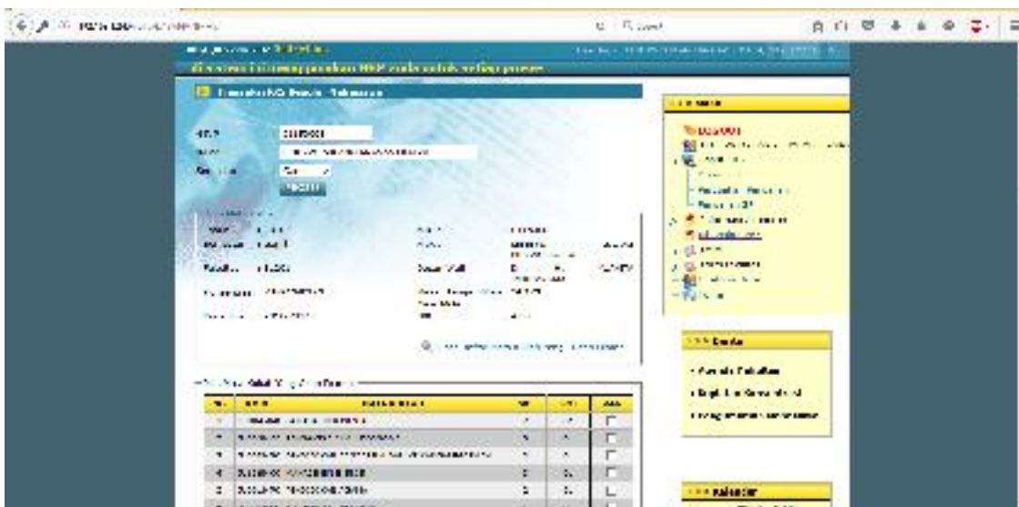
Form transaksi KRS

Klik menu Input KRS | Perwalian | pilih semester | proses sehingga muncul dialog sbb.: